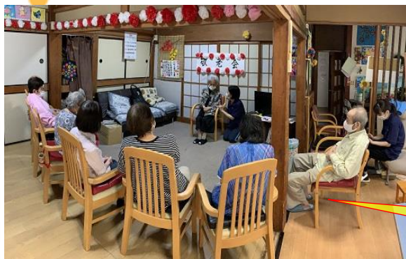
インタビューを見守る 皆様