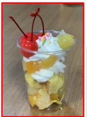
皆様美味しそうに 完食されました